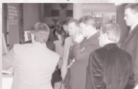
Minister Oppermann, ...