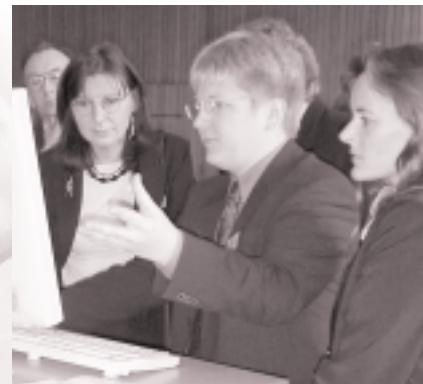
... und Ministerin Trauernicht informieren sich über OFFIS-Projekte

konnte hierdurch deutlich machen, dass in Oldenburg Spitzenforschung betrieben wird und dass das Institut »zu den Glanzlichtern der außeruniversitären Forschungseinrichtungen mit Sitz in Niedersachsen« (Ministerpräsident Siegmarr Gabriel) zählt und mit seinem Drittmittelaufkommen »mit den bundesweit besten Fraunhofer-Instituten vergleichbar ist« (Wissenschaftsminister Thomas Oppermann).