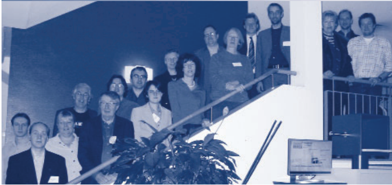
Projektstart: Treffen aller Beteiligten des europäischen Hearing at Home-Projektes im OFFIS