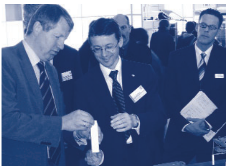
Minister Stratmann begutachtet die Sensorknoten in den Container-Modellen

Die OFFIS Bereiche BI und MN stellten auf der CeBIT intelligente Lösungen für die Logistik vor. Anhand eines Demonstrators – ein Modell eines Seehafen-Terminals, auf dem Container umgeschlagen werden – wurden die Forschungsarbeiten der beiden Bereiche zu den Themen „Intelligente vernetzte Mikrosysteme“ und „Integration dezentraler Informationen bei Containertransporten“ präsentiert. Diese Technologien ermöglichen eine Überwachung, Identifizierung, Ortung und Verwaltung von Waren.