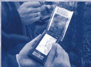
SmartGuide: der elektronische Wanderführer im Einsatz